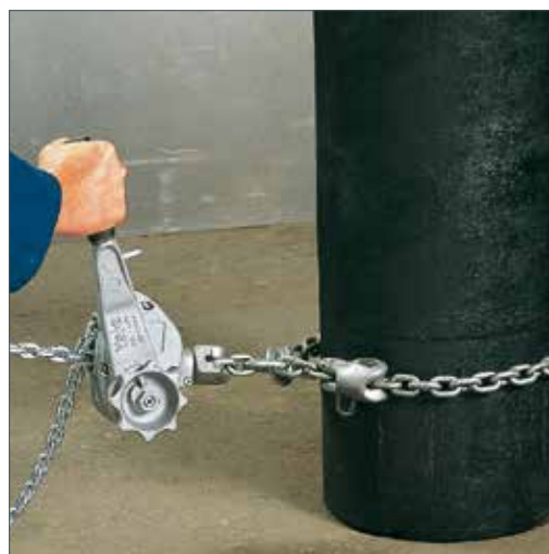
Zdvíhák s reťazou na vytvorenie slučky